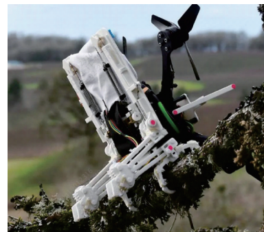
图 2 斯坦福 SNAG 鸟类仿生腿式起落架 [41]