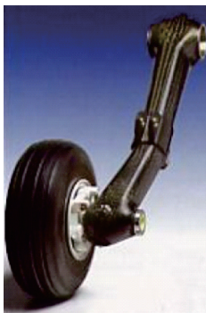
图 3 NH90 直升机起落架扭力臂

碳纤维增强树脂基复合材料凭借其优秀的比强度与比模量,满足滑橇式起落架的轻量化与功能一体化的设计需求,已成为轻小型及无人直升机起落架滑橇的首选材料。NH90 直升机起落架扭力臂进行了复合材料化尝试,通过树脂传递模塑 RTM 工艺进行制造。在同等刚度下,编织复合材料构件的疲劳寿命较铝合金提升了约 150%,如图 3 所示。